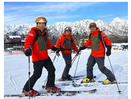
このウェアが目印です

テレマークスキーセットを始め、グローブ、ゴーグルなどのレンタルも完備（レンタル料別、消毒済み）、初めての方大歓迎! です。